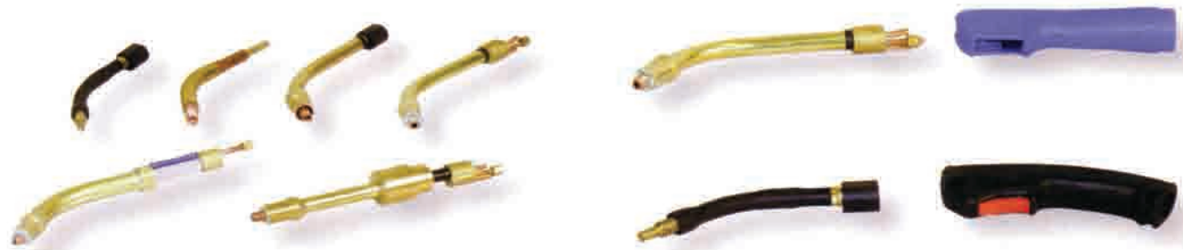
Potrošni dijelovi za MIG MAG gorionike