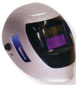
Zaštitna maska elektronska