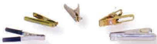
Kliješta za masu