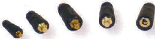
Priključak na kablju