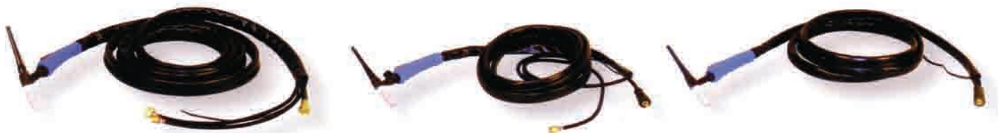
Gorionici za TIG zavarivanje