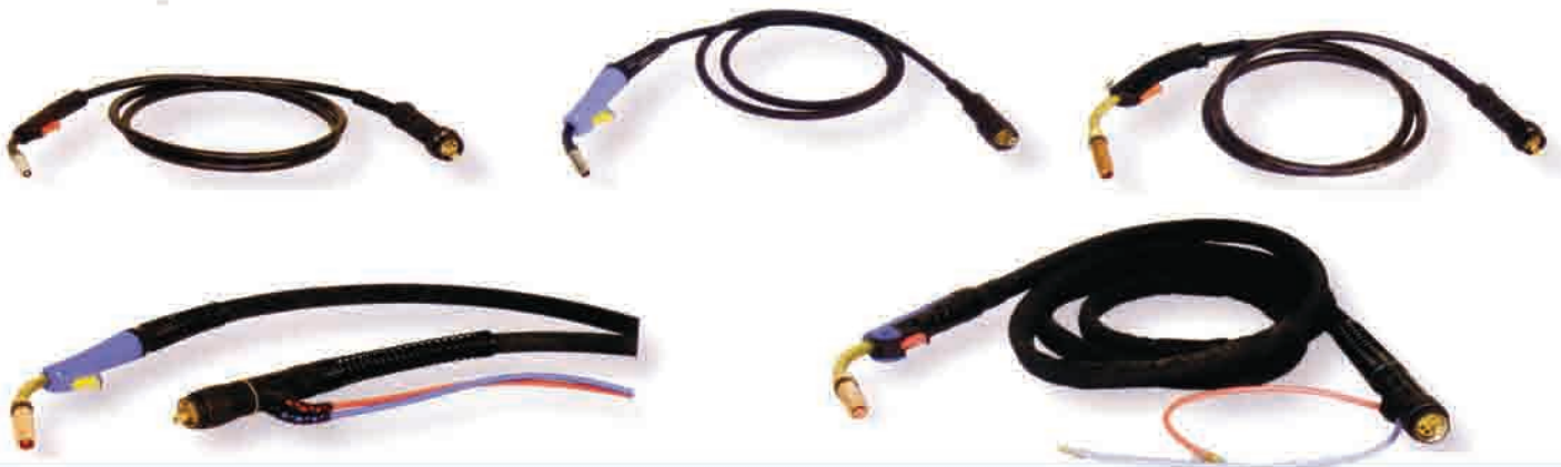
Gorionici za MIG MAG zavarivanje