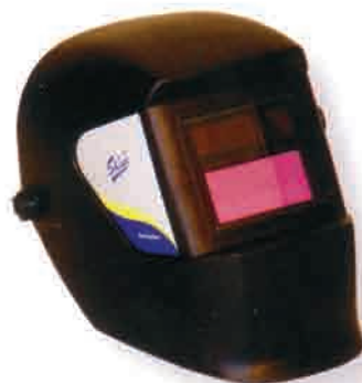
Zaštitna maska elektronska