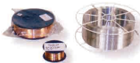
Žica za zavarivanje